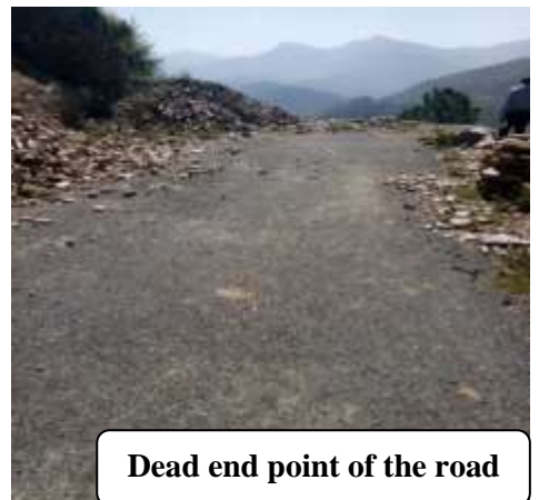
Dead end point of the road

अधिशायी अभियंता, पी0एम0जी0एस0वाई0 खण्ड, लो0नि0वि0, अल्मोडा के निर्माण कार्यो के लेखा-अभिलेखों की विस्तृत जाँच में पाया गया कि लिंक मार्ग बमस्यू से खुशियालकोट मोटर मार्ग में प्रति दिन यातायात हेतु ए0ए0डी0टी0 की संख्या 27 तथा सी0वी0पी0डी0 11 एवं अन्तिम बसावट के छोर (dead end) तक ही मोटर मार्ग होने के बावजूद भी सड़क की चौड़ाई 3.75 मी0 प्रावधानित एवं सम्पादित की गई, जबकि विशिष्टियों के अनुसार लिंक मार्ग में प्रति दिन 100 से कम मोटर वाहनों का यातायात घनत्व तथा dead end होने पर सड़क की चौड़ाई 3.00 मी0 होनी चाहिए थी। लेखापरीक्षा दल द्वारा मार्ग के भौतिक निरीक्षण में पाया गया कि उक्त मोटर मार्ग रानीखेत-खैरना मोटर मार्ग से प्रारम्भ होकर अन्तिम बसावट खुशियालकोट जनसंख्या 676 में 4.27 किमी0 तक निर्मित किया गया था जैसा फोटोग्राफ से ज्ञात किया जा सकता है। इस प्रकार, निर्धारित